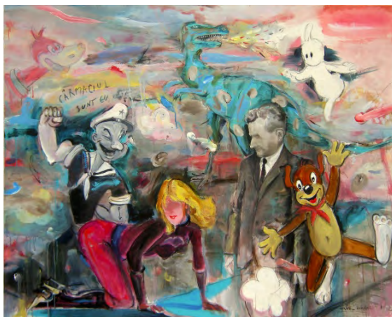
Fig. 11. Andor Komuves, Povesti reciclate , acryl pânza 114x146 cm, 2012

Pictura Suntem Superfrati OK (fig.10), realizată în culori acrylice pe pânză, de 100x 80 cm, 2008, relevă două aspecte. Primul e izbitor datorită evocării personajelor ultracunoscute dintre care unul este extras din întinericul istoriei comunismului – Lenin, iar celălalt, eroul de film și benzi desenate, americanul Superman suprapun imaginea a două realități dramatice și fictive. Al doilea aspect constă în folosirea mijloacelor din pop-art, fapt care oferă lucrării concretețe și o reprezentare de tip narativ ce caracterizează gusturile consumeriste în percepția mesajului. Personajele desenate cu precizie, fără să permită confuzii în privința identității sunt prezente potrivit imaginii difuzate în masmedia, ca eroi autoritari, de forță, militanți. Asocierea într-o scenă plină de imaginar și realism trimite la contradicția dintre conștiință și manipulare față de politică, la globalizare și mass-media. Pictura Povesti reciclate în culori acrylice, pe o pânză de 114 x146 cm în 2012 (fig. 11) este un fragment extras dintr-o lume plină de neverosimil și