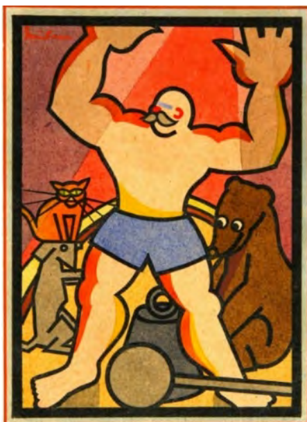
Fig. 1. GR.1229 Gunbaum Ernest, Halterofil . Lucrare aflată în Muzeul Țării Crișurilor din Oradea