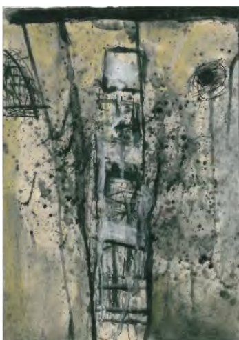
Fig. 12. Ioan Augustin Pop, Semnele naturii , 100x100 cm, 1980 (stânga)