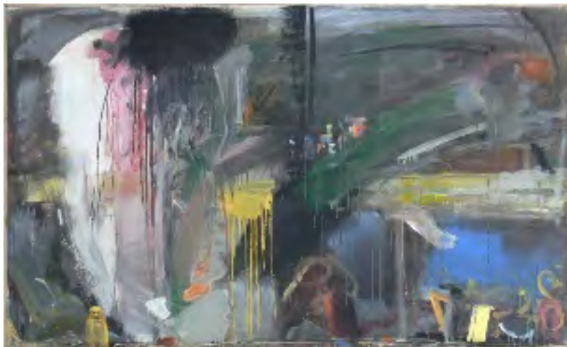
Fig. 8. Gheorghe Ilea, Vagon cu motorină II 120x200 cm, tehnică mixtă pe pânză, 1987

motorină din 1987 (fig. 8) constă într-o imagine expresionist-abstract în care subiectul propus de Ilea constă în materia ca pretext al eliberării de energie.