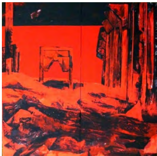
Fig. 16. Ioan Augustin Pop, Miniu de plumb din ciclul Arheologii Industriale , 200x 200, 2011 Expoziția Despre M.I.N.E. culori acrilice pe pânză