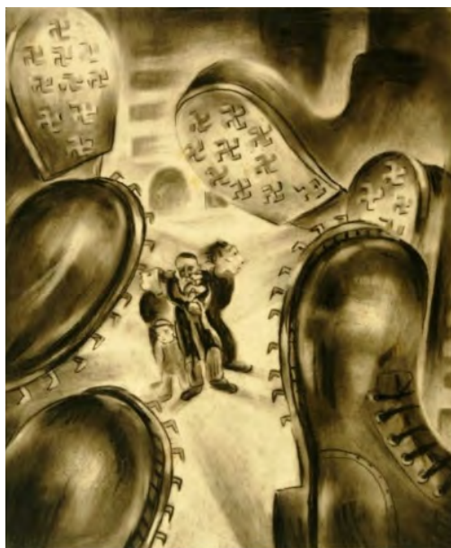
Fig. 2. GR.1271 Leon Alex, Cizma fascistă . Lucrare aflată în Muzeul Țării Crișurilor din Oradea

Revenim în acest sens, simetric analizei anterioare 2 : reacția ludică, universul la limitele dintre contingent și ficțiune, conștient și inconștient, spectaculozitate și imagine în determinările timpului și spațiului real, materia și perisabilitatea picturală, poetică și underground, restructurare compozițională, rupturi și transferuri semantice între tradiția modernă și interacționări stilistice, cromatismul violent, misterul și brutalitatea, transferul formal între abstracție și conținutul epic al reprezentării.