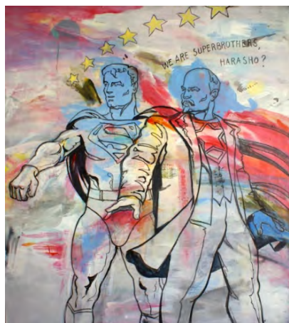
Fig. 10. Andor Komuves, Suntem Superfrati OK , acryl pe pânză, 100x80 cm, 2008

Tematica realității din pictura lui Komives nu este tratată ca pictura realistă din secolul al XIX-lea în viziunea lui Grant Devolson Wood ori a picturilor americani de la începutul secolului al XX-lea și nici în spiritul neorealismului de la începutul deceniului opt. Tematica este o reactivare a realității în care percepția vizuală este constrânsă între sensibilitate, anecdotă și cinism, între imagini contradictorii și mixaje stilistice.