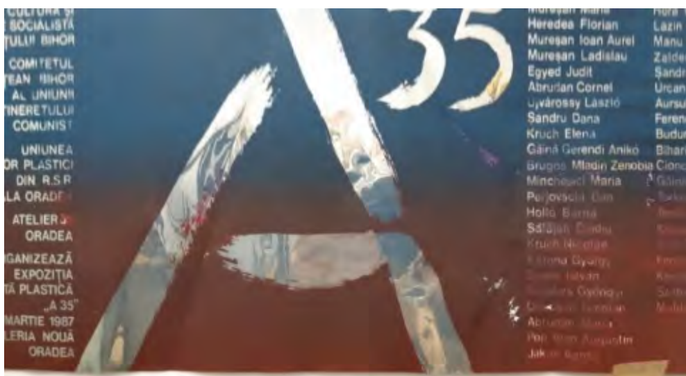
Fig.3. Afiș al grupării A35, Oradea