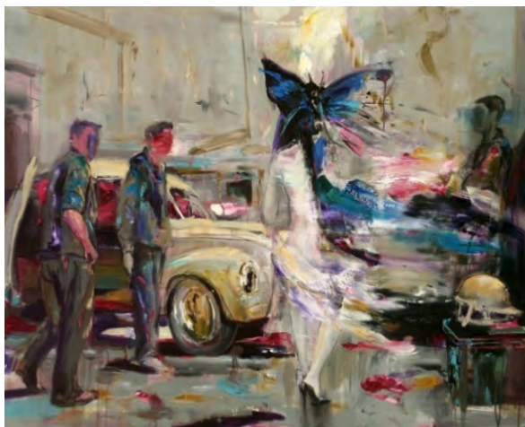
Fig. 6. Andor Komives, Fascinatia Wartburgului, 162x130 cm, ulei pe pânză, 2017