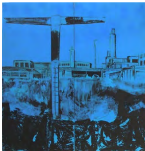
Fig. 17. Ioan Augustin Pop, Miniu de plumb , din ciclul Arheologii Industriale , 200x 200, 2010, Expoziția Despre M.I.N.E. culori acrilice pe pânză