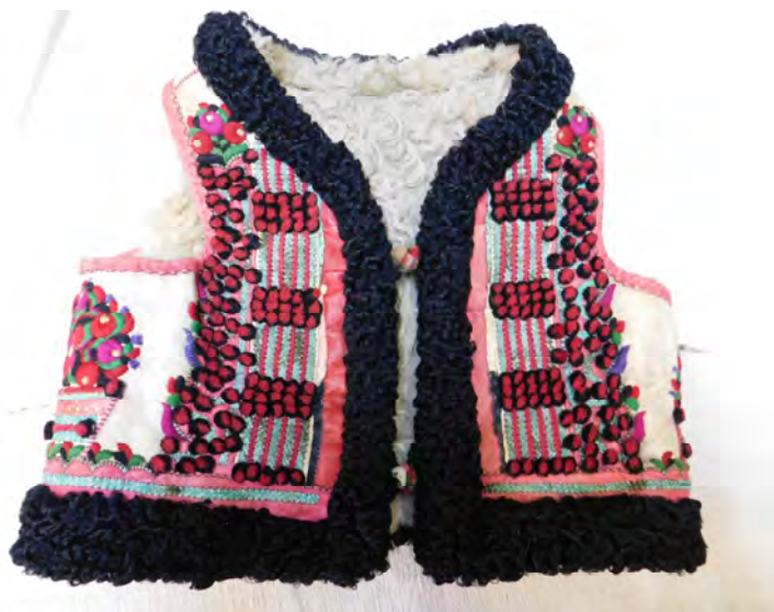
Fig.2. Cojoc binșenesc muieresc (față). Muzeul Municipal Beiuș.

https://fekete-koros-volgy.neprajz.hu/neprajz.fenykep02t.php?bm=1&kr=G_803_%3D%22FeketeK%C3%B6r%C3%B6s14%22