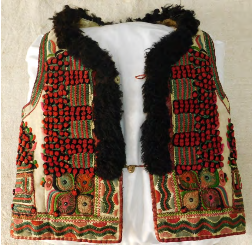
Fig.3. Cojoc bișnenesc bărbătesc (față). Muzeul Municipal Beiuș.