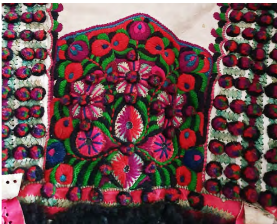
Fig. 5, 6, 7. Variante de pană mare la cojoc muieresc. Muzeul Municipal Beiuș.