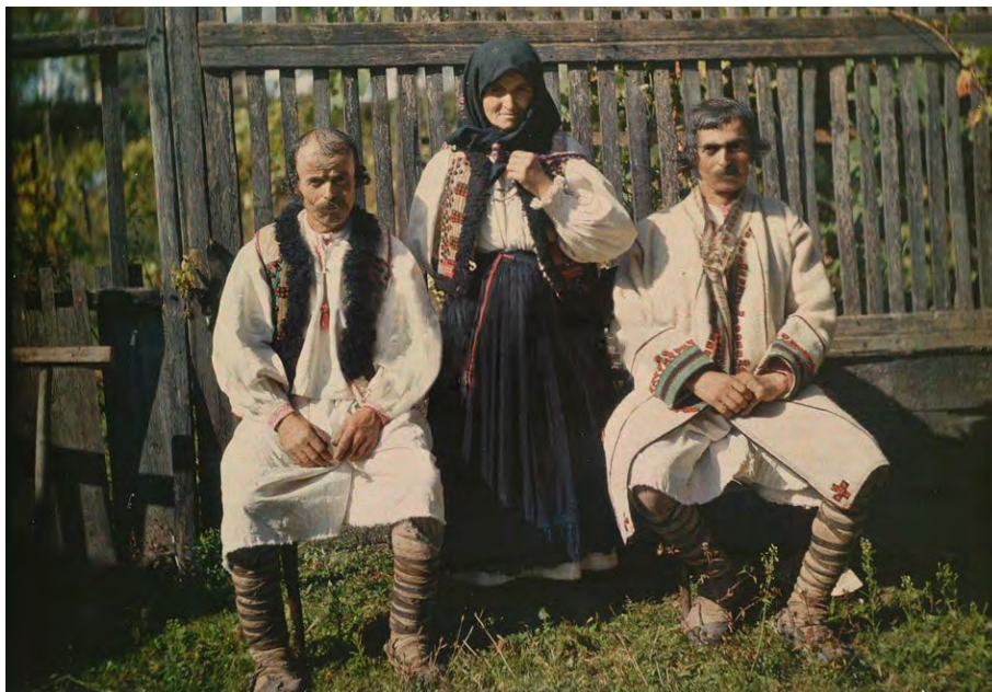
Fig.1. Țărani din Totoreni în port tradițional îmbrăcați cu cojoace binșenești și suman. Foto Györrffy István, 1911, arh. Muzeului de Etnografie, Budapesta.

https://fekete-koros-volgy.neprajz.hu/neprajz.fenykep02t.php?bm=1&kr=G_803_%3D%22FeketeK%C3%B6r%C3%B6s14%22