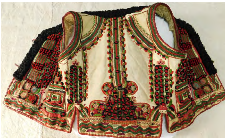
Fig.11. Cojoc binșenesec bărbătesc (desfășurat). Muzeul Municipal Beiuș.