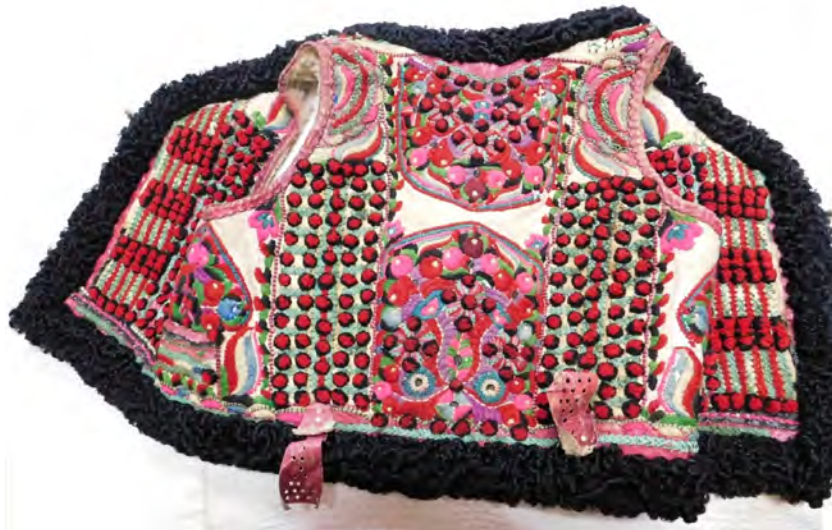
Fig.4. Cojoc bișnenesc mueresc (desfășurat). Muzeul Municipal Beiuș.