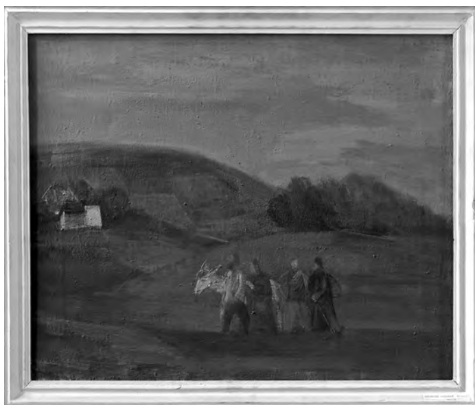
GHEORGHE GHERMAN - DRUMEȚI , 50x62 cm, ulei pe pânză, inv.P.917, col. M.T.C.