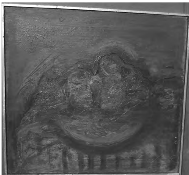
FLORIAN HEREDEA - NATURĂ STATICĂ , 70 x 80 cm, tehnică mixtă