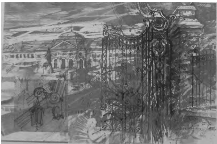
FLORIAN HEREDEA - MUZEU , 35x50 cm, tehnică mixtă