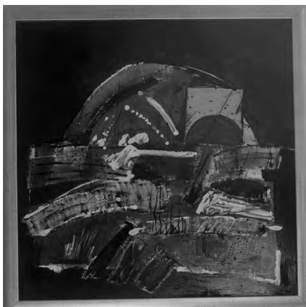
AUREL ROȘU - SFÂRSIT DE IARNA , 50x50 cm, tehnică mixtă