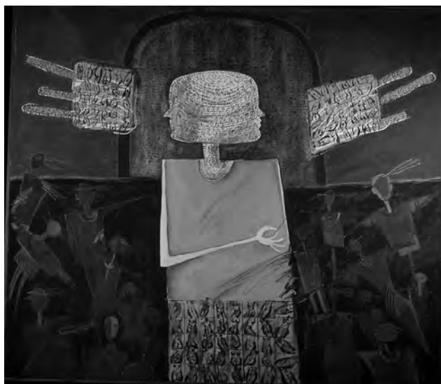
AUREL ROȘU - ILUZIONISTUL , 140x170 cm, acril pe pânză, inv.P.1024, col. M.T.C.