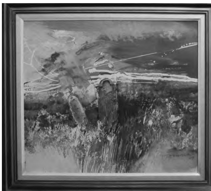
FLORIAN HEREDEA - IN MEMORIAM , 50x60 cm, tehnică mixtă