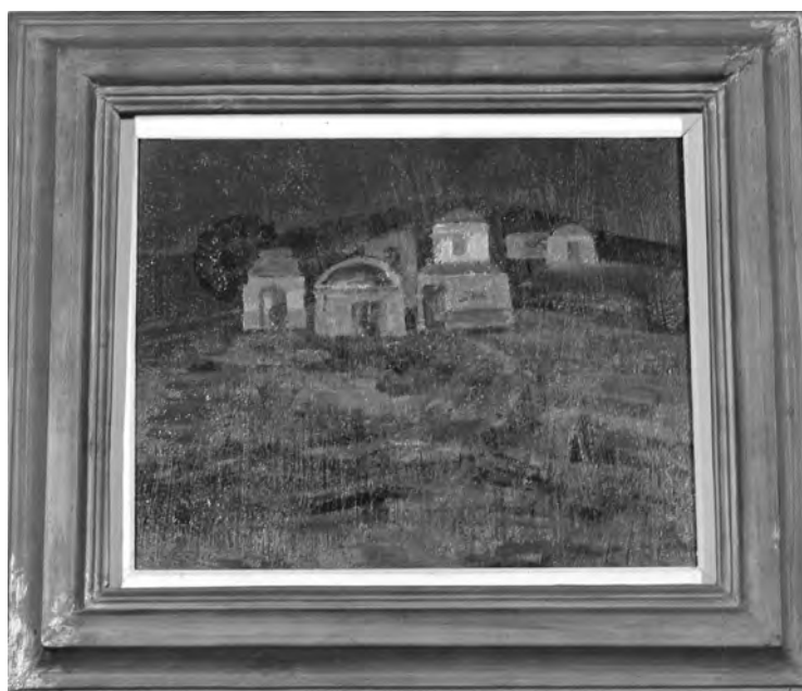
GHEORGHE GHERMAN - PEISAJ CU CASE , 21x26 cm, ulei pe placaj, inv.P.999, col. M.T.C.