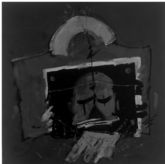
AUREL ROȘU - MASCA , 70x70 cm, tehnică mixtă