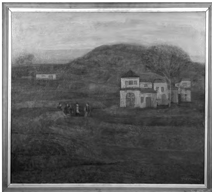
GHEORGHE GHERMAN - PEISAJ DE SEARA , 80x90 cm, ulei pe pânză, inv. P.959, col. M.T.C.