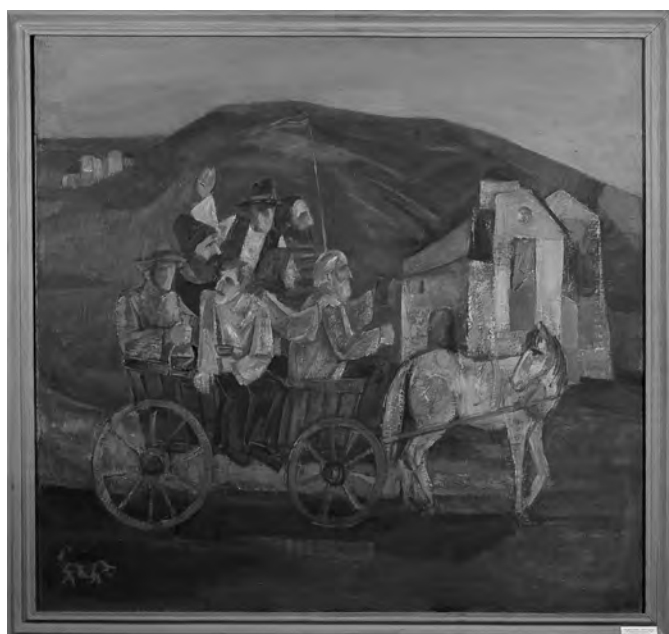
GHEORGHE GHERMAN - SĂRBĂTOARE , 90x85 cm, ulei pe pânză, inv.P.896, col. M.T.C.