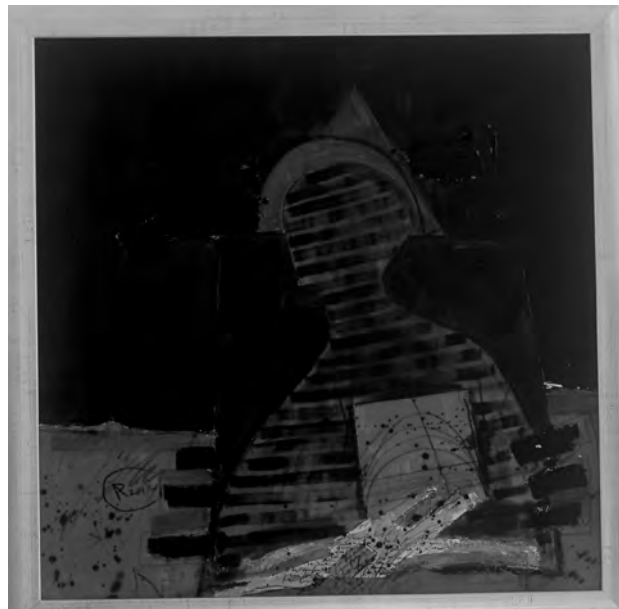
AUREL ROȘU - UMBRA , 50x50 cm, tehnică mixtă