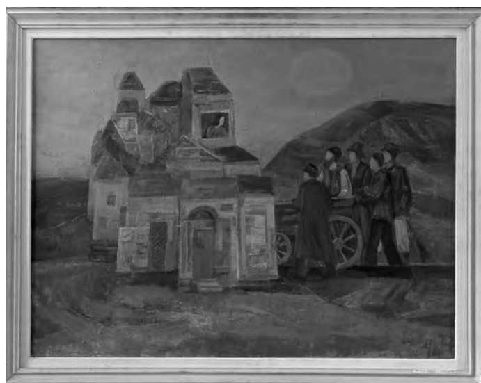
GHEORGHE GHERMAN - ÎNTÂMPINARE , 65x86 cm, ulei pe pânză, inv.P.888, col. M.T.C.