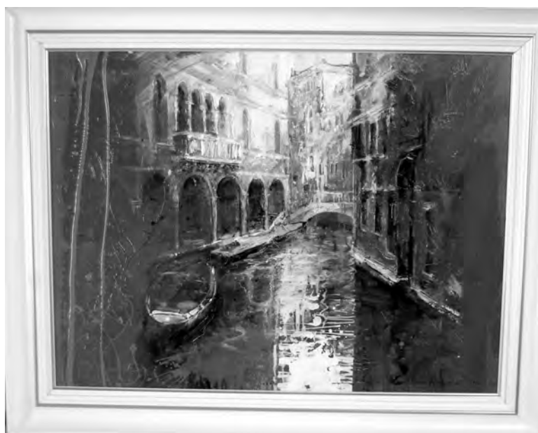
FLORIAN HEREDEA - VENEȚIA , 50x70 cm, tehnică mixtă