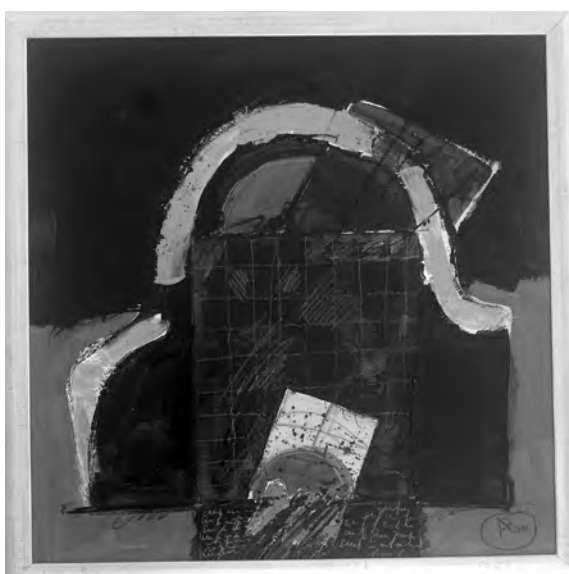
AUREL ROȘU - AMURG LA MARE , 50x50 cm, tehnică mixtă